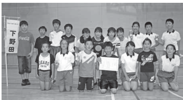
▲優勝 下野田Aチーム