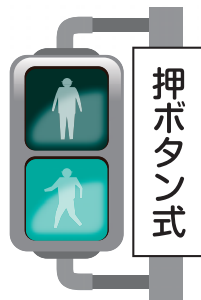
歩行者灯器 歩行者はこちらに従います