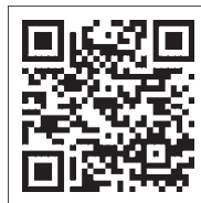
▲予診票再発行はこちら

また、妊婦の感染を予防するために、県が実施する「風しん抗体検査事業」と併せて、検査後に風しんの抗体価が低いとされた人に対して、風しん予防接種費用の一部を助成しています。詳しくは町ホームページをご確認ください。