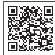
▲大人の風しん予防接種の一部助成について (町ホームページ)