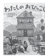
わたしのおひっこし