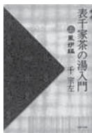
表千家茶の湯入門 上・下巻