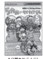
5分間のサバイバル 科学クイズにちょうせん! 5年生