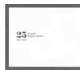
Finally (安室 奈美恵)