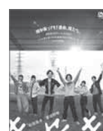
キセキ -あの日ソビト-