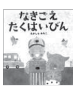
なぎごえ たくはいびん