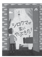
シロクマが家にやってきました!