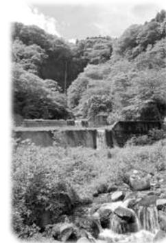
立ち入り禁止が 解除された 船尾滝

★移住支援金事業 500万 円 ★地域特産品生産体制構築事業 200万 円 老朽化した農業用水路の更新 825万 円 林道栗籠・井堤線の開設(設計・工事) 3,100万 円 よしおか再発見ウォークの開催 4万7千円 住宅リフォーム資金の助成 300万 円 ★新技術・新製品の開発助成 40万 円 観光PR事業 294万5千円