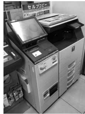
▲キオスク端末の例