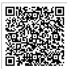
▲町ホームページはこちら