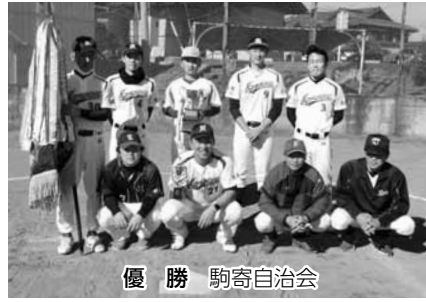
優勝 駒寄自治会 準優勝 寺下自治会