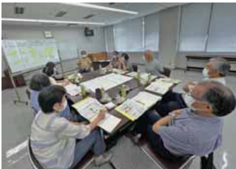
▲明治地区協議体 目指す地域像 『(明)るく若い力とともに(治)める町づくり —ず〜っと住み続けられる町—』