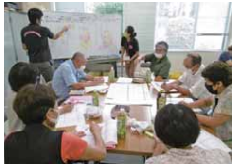
▲駒寄地区協議体 目指す地域像 『生き生きタウン駒寄 〜ふれあい・助けあい・育てあいの地域力〜』

社会福祉協議会では、町の委託により明治地区・駒寄地区で生活支援体制整備事業を実施しており、地域住民で構成される「協議体」を設置しました。現在行っている支え合い活動などの地域の情報を共有し、将来に向けて「自分たちのまちをどのような地域にしたいか」などを話し合います。活動同士のつながり、見守り活動、趣味や体操などによる居場所づくりなど、その地域ならではの支え合いの仕組みづくりをできる範囲で考えていきます。