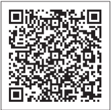
▲町ホームページ(マイナンバーカードの申請・交付について)はこちら

住民環境室窓口で行います。申請・受け取りに必要な書類などは町ホームページまたは広報よしおか12月号をご確認ください。