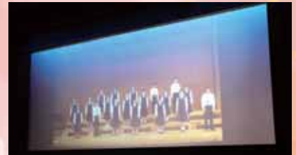
吉中合唱部が歌でお祝い