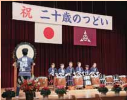
上州吉岡船尾太鼓による記念演奏