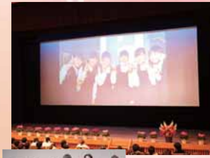
元吉中生徒会役員による思い出ムービーの上映