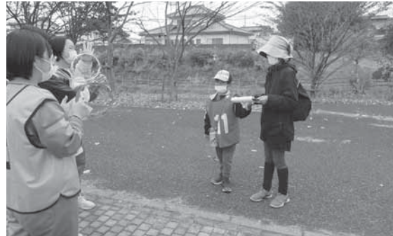
三宮神社のチェックポイントでクイズに答える家族