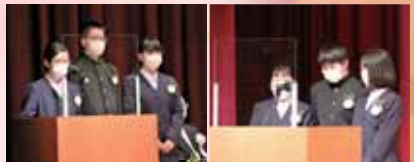
吉中ボランティアも大活躍