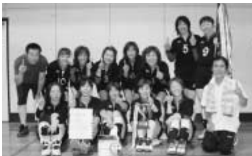
▲1部リーグ優勝 リンド9

準優勝 小倉自治会 ウェルネス 第3位 大久保寺下自治会 寺下バレーボール愛好会