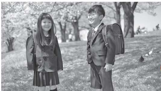
男女共同参画としての取り組みとなる