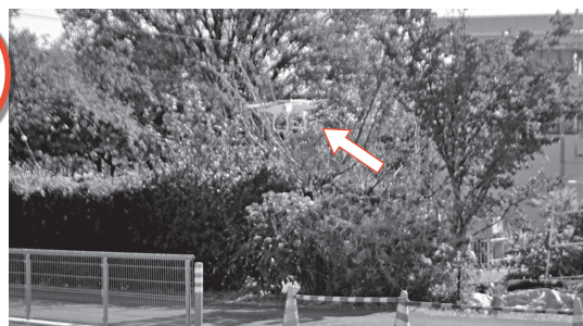
訓練中のドローン