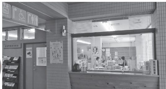
申請窓口も増やした(教育委員会)

HPをわかりやすくし、申請に必要な書類を減らした。新入学児童・生徒学用品購入費を前倒し支給した。