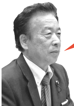
こいけ はるお 小池 春雄 議員