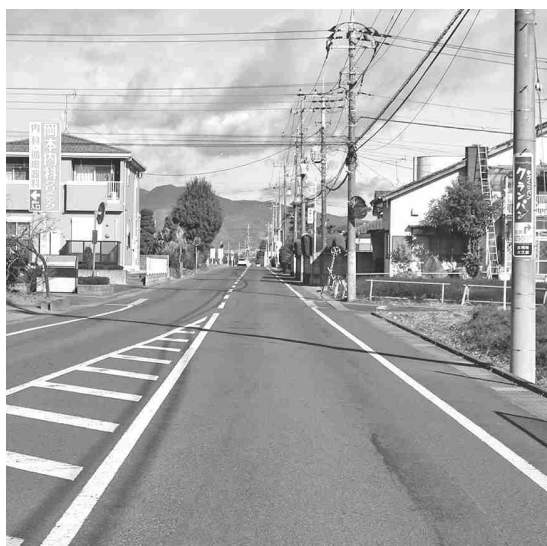
県に対する町の対応の真価が問われる (吉岡バイパス延伸予定地)

吉岡バイパス延伸につ いては、今現在着手に 向けて検討の位置づけ、 町は県に対しデータに 基づく必要性を明確に 示す必要があるのでは。