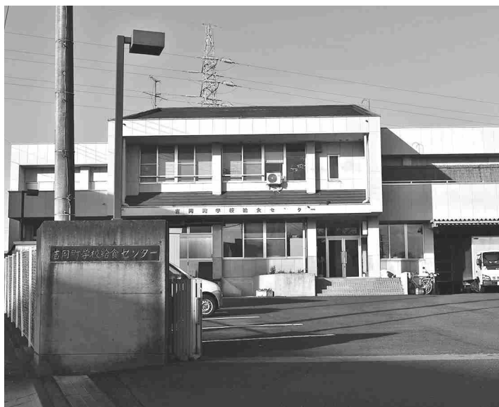
建て替えには高額の費用が必要となる（給食センター）

答 教育委員会事務局 長 請願者との意見交換を行った際に、早急な着手・完成は難しいことに理解は得られたと思う。