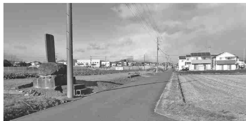
商業誘致エリアにはジョイフル本田の出店が 計画されている（道路改良工事予定地）