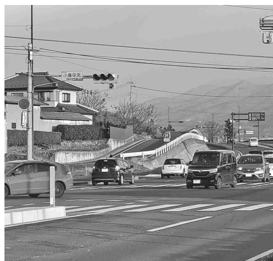
想定より早く設置された地域住民待望の右折信号機 (小倉中央交差点)