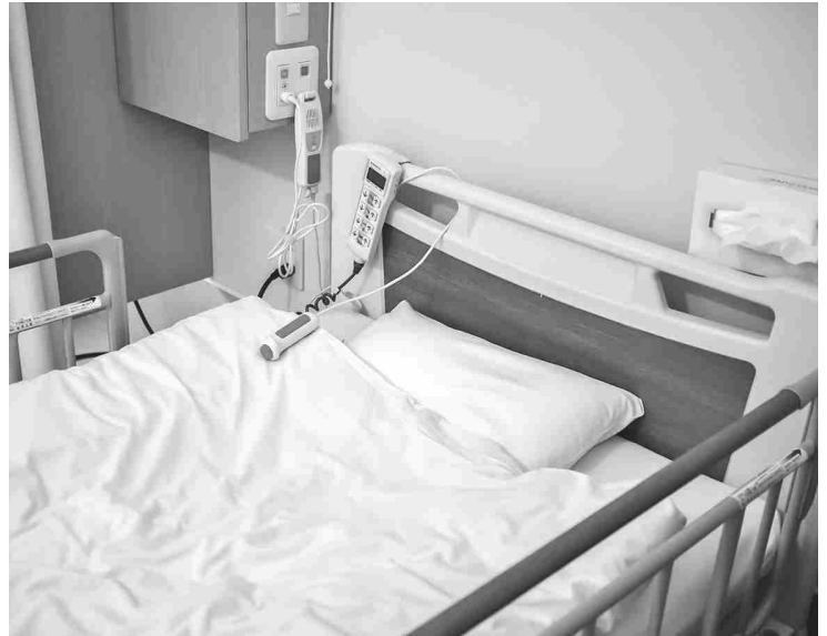
入院費のみの助成で、全医療費無料化は先送りに

答 入院すると、医療費のほかには食事療養費など自己負担があり、経済的負担も大きくなる。子育て支援もかねて18歳年度末まで拡大する。全医療費分