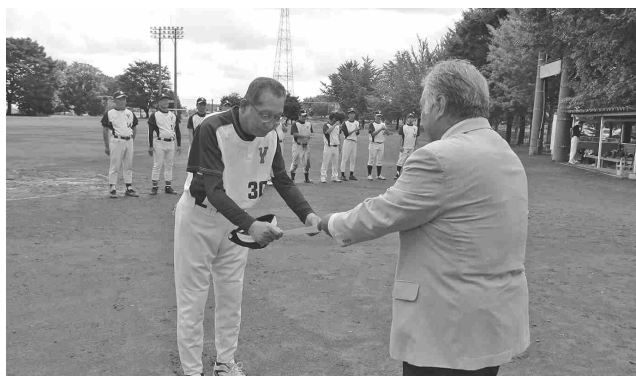
町民野球交流大会表彰式