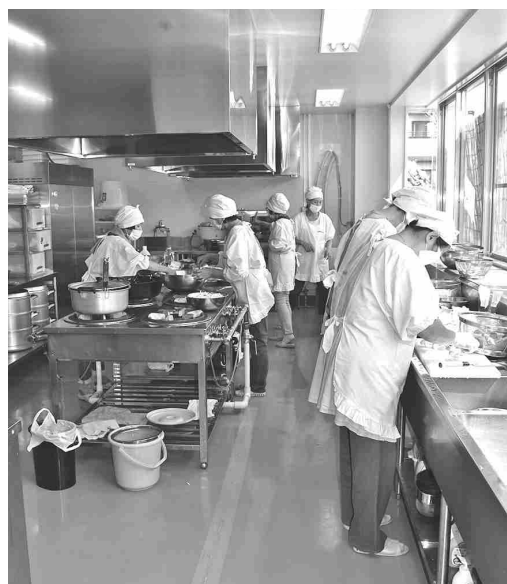
利用者負担分を助成している（配食サービス）

介護福祉課長 社 会福祉協議会で行 う配食サービスや移送 サービスの、利用者負 担分の助成を継続。援 護が必要な人に対する 地域ぐるみの助け合い