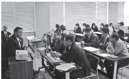
町長はじめ、99人の職員が参加した