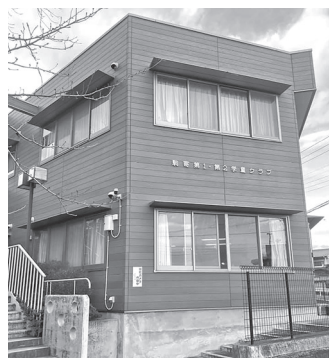
30分の違いは大きい