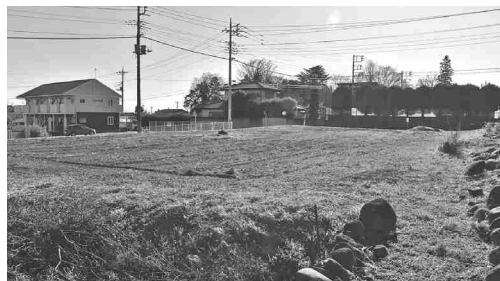
新設により85人の定員増を計画している (建設予定地)