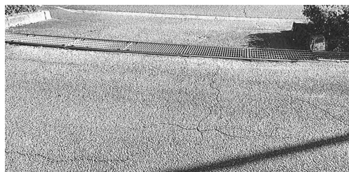
網目の間隔が大きく、車いすの車輪がはまる などの問題があった（グレーチング蓋）