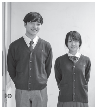
全医療費の無料化まで 進めてほしい

令和2年第4回定例会は、12月1日から8日まで、8日間の会期で行いました。令和2年度補正予算など議案14件・諮問1件が提案され、いずれも原案通り可決しました。また、請願1件・陳情2件が提出され、請願1件・陳情1件を継続審査、陳情1件を不採択にしました。