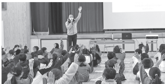
防災専門員による防災講習会 (駒小)