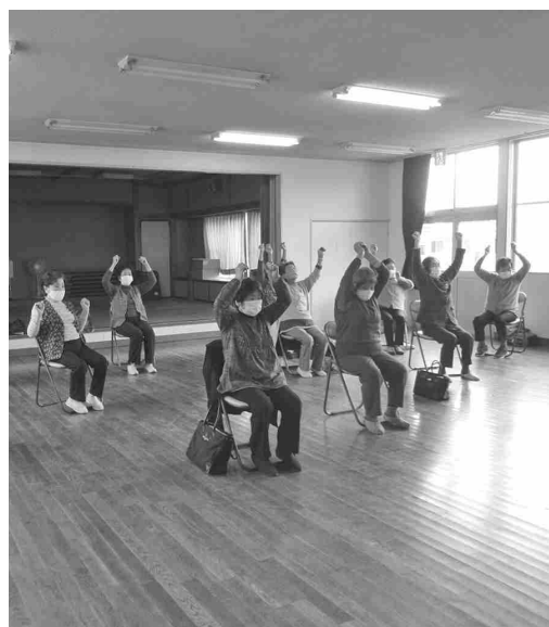
みんなで仲良く筋トレ中（駒寄老人クラブ）

答 産業観光課長 サ ウナは本年度に工 事設計、来年度に取 え工事を行う。通年券は これに代わるサービスを 検討中。その他の改善要 望も利用者の満足度向上 に努めていく。