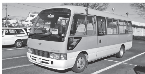
選手以外の部員を輸送する町有マイクロバス

令和元年度の駅伝部の関東大会出場時に、利用を許可した。今後も公務を妨げない範囲で対応する。