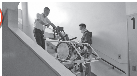
児童が移動しやすいよう時間割も配慮している