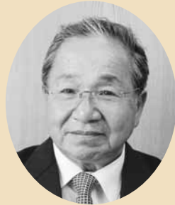
副議長 馬場 周二

5月8日臨時会において、議員の皆さまのご推挙を受け副議長に就任しました。身に余る光栄であるとともに、責任の重さを痛感しております。