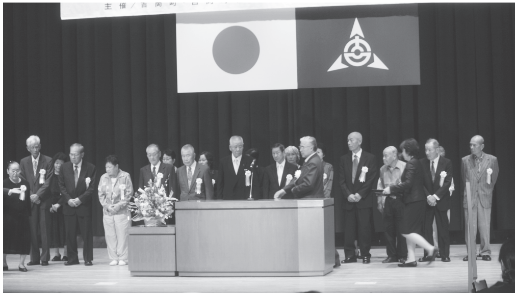
敬老福祉大会金婚表彰

歳入歳出差引額は5億8 905万円、歳入歳出差引 額から翌年度へ繰り越す財 源を引いた実質収支額は、 5億2668万円でした。 Ⅱ全会一致で認定Ⅱ