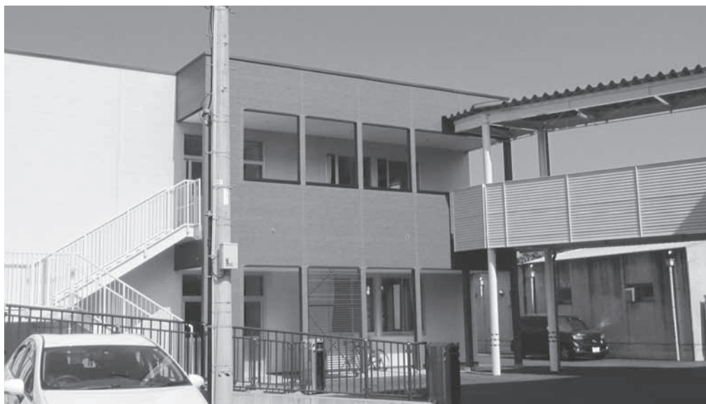
増築された特別教室棟（駒寄小）