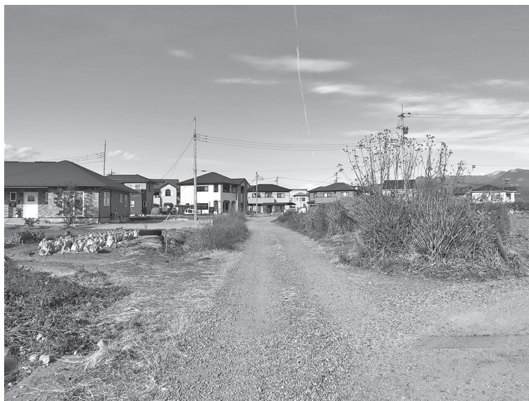
住宅地の未舗装道路