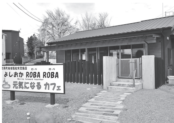
毎週、複数回の開催が望まれるロバロバ

答 町長 滝周辺の地 形地質を考慮し、 豊かな自然環境を維持。 埋もれていた資源の魅 力を生かすことで、船 尾滝を起点とした周遊 式観光の場ができれば と考えている。