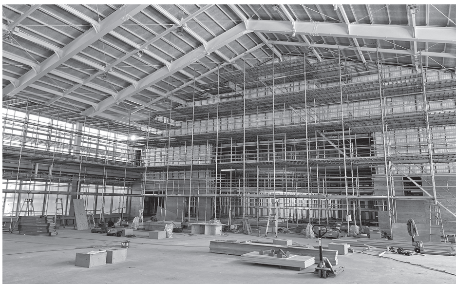
早期完成が求められる（駒小体育館）

答 総務政策課長 地 域情報プラットフォーム の取り組みとは 異なるが、4月からの 機構改革で設置される 「住民課」に戸籍・住 民基本台帳業務、国保 関係、高齢者医療、福 祉医療などの窓口業務 を集約。総合窓口的機 能を有することにな る。また、向かいに「介 護福祉課」を置くこと により住民の移動負担 軽減につながるよう取 り組む。