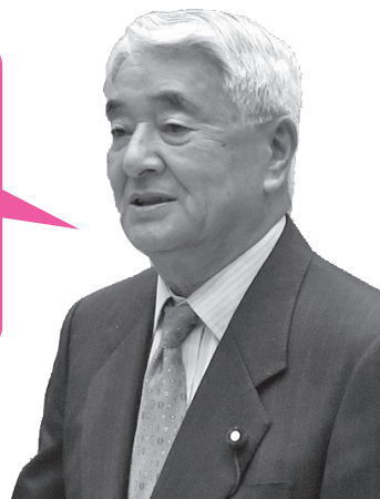
ひろしま たかし 廣嶋 隆 議員