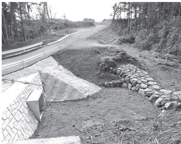
令和元年度完成の林道栗籠・井堤線とデ・レイケ自害沢9号堰堤

答 教育委員会事務局 長 平成22年度にサルモネラ菌による食中毒が発生。原因は給食センターの汚染など衛生管理体制に不備があった。再発防止策は、食材の検収体制の見直し、洗浄消毒の徹底など、町独自のマニュアル作成を実施した。