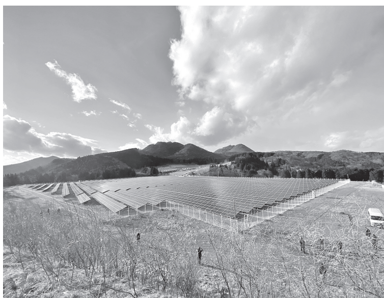
スラグ問題への適切な対応が求められる (榛東村メガソーラー)

と思うが、町長の見解は。 答 町長 吉岡町の水源に影響を与える場所。大同特殊鋼に対し、水源に影響を与えないよう、将来にわたる適切な対応をするよう求め、榛東村と連絡を取り合い協力し対応していく。