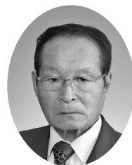
吉岡町商工会 会長