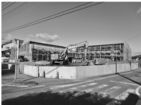
2月完成予定の明治第2学童クラブ