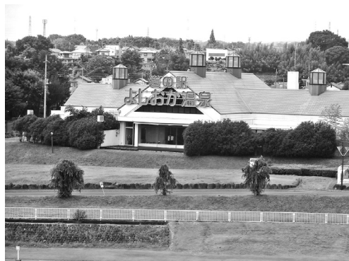
露天風呂付き大浴場のよしおか温泉