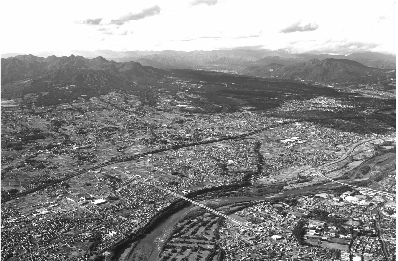
榛名山麓から利根川まで広がる吉岡町は、人口増や企業の進出などで今後も発展を続けていく