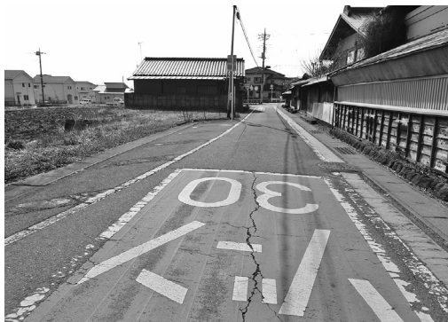
拡幅される通学路（北下）

令和4年第一回定例会は3月1日から16日まで、16日間の会期で行いました。議案30件・諮問1件・発委1件が提案され、原案通り可決しました。また、請願1件を採択しました。