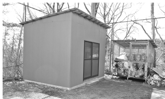
回収した資源ごみを一時保管するストックハウス

ごみの減量・資源の再利用などの意識高揚を図り、実施の自治会などに補助金を交付する。