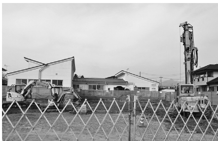
建設中の園舎（第五保育園）