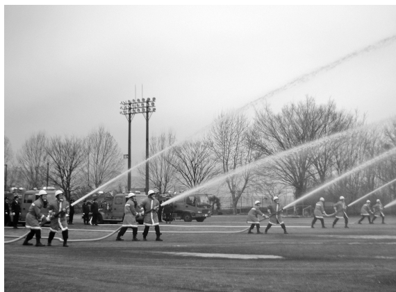
訓練をかさねる消防団員