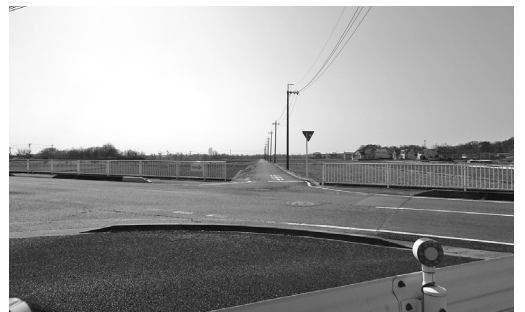
第1工区の起点となる交差点