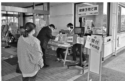
保健センターでの集団接種