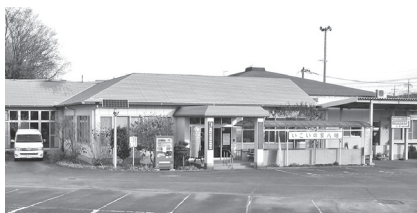
指定期間は令和10年3月まで

老人福祉センターの指定管理者に社会福祉法人吉岡町社会福祉協議会が再指定されました。