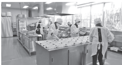
ボランティアを通じて健康増進・地域活性化を目指す

ボランティア活動に応じたポイントを付与することによって、参加意欲の向上を図るほか、高齢者の日常生活支援や見守りを行うボランティアを増やすことで地域福祉の向上を目指す。