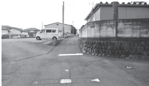
狭い通学路を拡幅する（駒小付近）

学校・教育委員会・道路管理者・警察が行った通学路合同点検に基づく危険箇所の交通安全対策。町道宮田・田端線（駒小付近）と町道三国線（明小付近）の道路改良工事を行う。