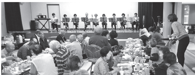
高齢者の居場所として重要 (老人福祉センター)

答 当初15人分を予算計上したが、年間の出生者が7人増加により22人と見込んだため。