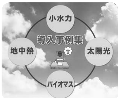
新エネルギー導入事例集（群馬県）

環境負荷の少ない新エネルギーを、まちの地域特性にあわせて導入するための方針を作成します。