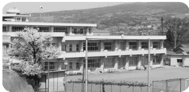
吉岡中学校南校舎

南校舎の防音工事を実施して学習環境を改善し、併せて空調設備を更新します。また障がいを持つ生徒や保護者などに配慮するため、北校舎にエレベーターを設置します。