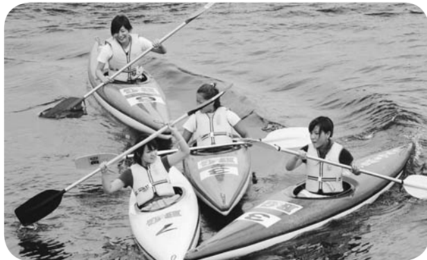
大樹町でのカヌー体験

友好都市となった北海道大樹町で、次代を担う吉岡町の子どもたちが宿泊体験活動を行うための予算です。