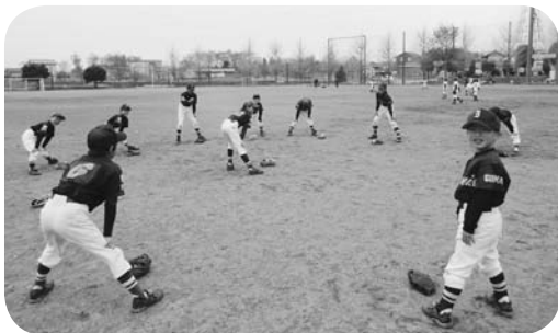
八幡山グラウンド