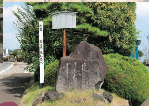
■佐渡街道道しるべ MAP I-5

重久は、日本で2番目の農学書「養蚕育手鑑」を著した養蚕の先導者。墓は県指定史跡。