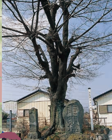
■三国街道一里塚 MAP G-3