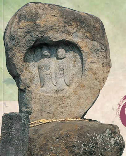
■双体道祖神 MAP G-3