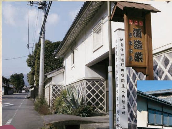
■森田家（野田宿本陣） MAP G-3

本陣の森田家には、細川侯の奥方や、高野長英ら有名な学者や文化人が泊まった記録があります。