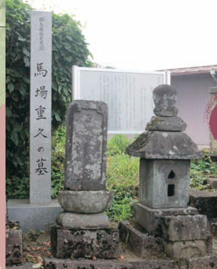
■馬場重久の墓 MAP G-4

重久は、日本で2番目の農学書「養蚕育手鑑」を著した養蚕の先導者。墓は県指定史跡。