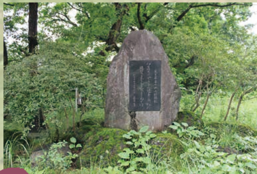
■万葉歌碑 MAP D-2