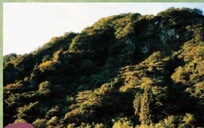
■九十九谷 MAP A-2