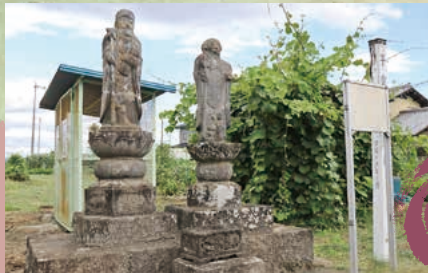
■子育て地藏 MAP I-5

佐渡街道と伊香保道との分岐点に建つ道しるべ。「右えちご左いかほ」と刻まれています。