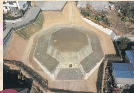
■三津屋古墳 MAP I-5