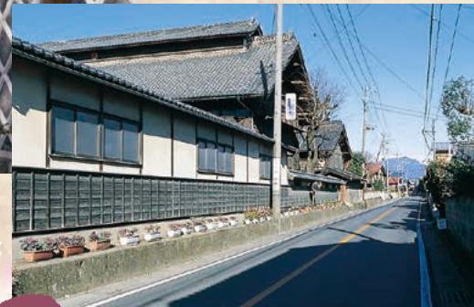
■大久保宿養蚕農家群 MAP I-6