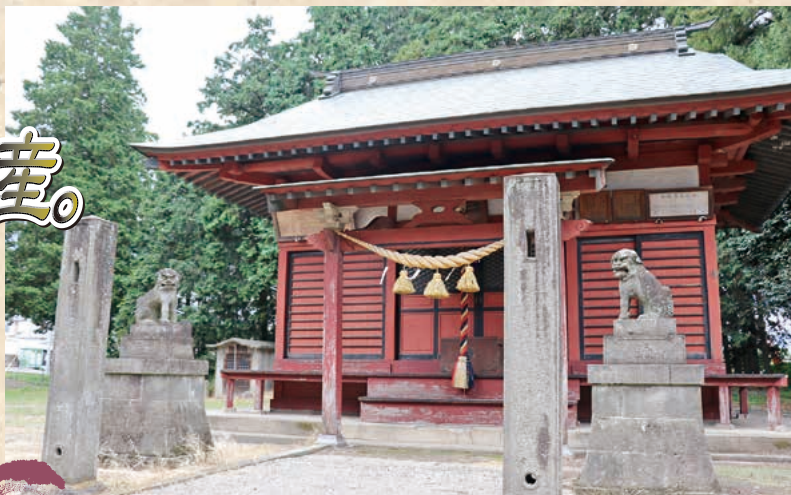
■三宮神社 MAP H-5

本陣の森田家には、細川侯の奥方や、高野長英ら有名な学者や文化人が泊まった記録があります。