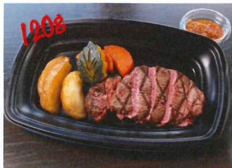
アメリカ産牛 ヒレステーキ 1680円 (税抜)