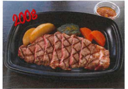
アメリカ産牛 サーロインステーキ 1480円 (税抜)