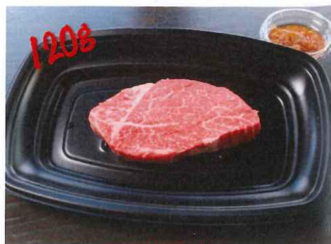
上州牛 ヒレステーキ 2980円 (税抜)