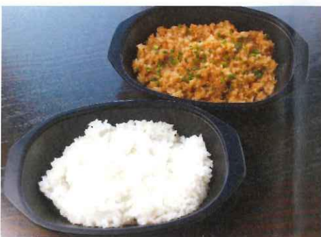
ライス 150円 (税抜) ガーリックライス 450円 (税抜)