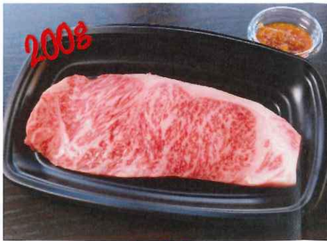
上州牛 サーロインステーキ 2980円 (税抜)