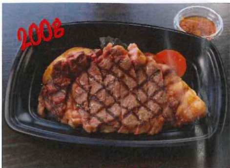
アメリカ産牛 リブアイスステーキ 1980円 (税抜)